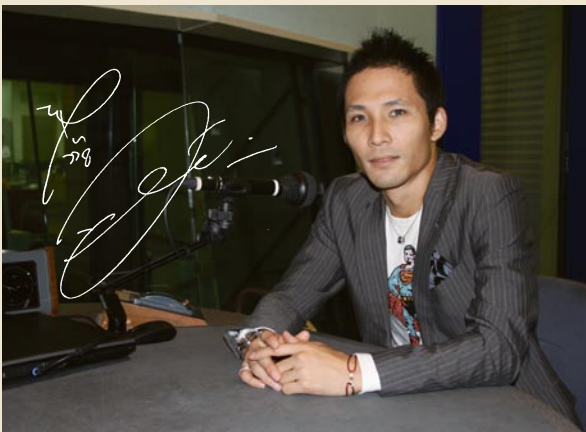
ZIP-FM収録スタジオにて